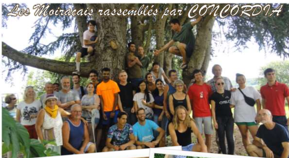
Les Moiracais rassemblés par CONCORDIA