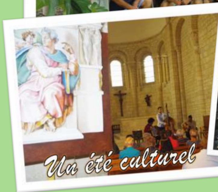
Un été culturel