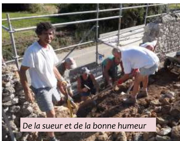
De la sueur et de la bonne humeur