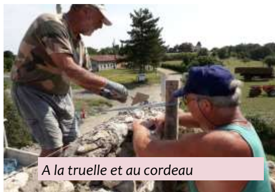
A la truelle et au cordeau

Le chantier de juillet 2018 consistait à démolir puis rebâtir le vieux mur qui menaçait ruines. Au fil des ans des chênes avaient poussé le long du mur et risquaient de le faire tomber. Après dessouchage mécanique, il était nécessaire de le reconstruire pour sécuriser la circulation auto et piétonne du quartier. Le recours à l'association Concordia était une évidence en terme de coût et de liens intergénérationnels.