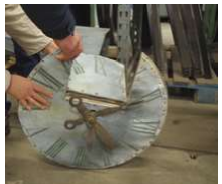
La fenêtre façonnée dans le cadran permettait la mise à l'heure