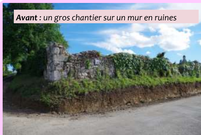
Avant : un gros chantier sur un mur en ruines