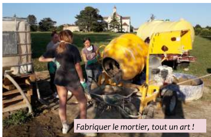
Fabriquer le mortier, tout un art !