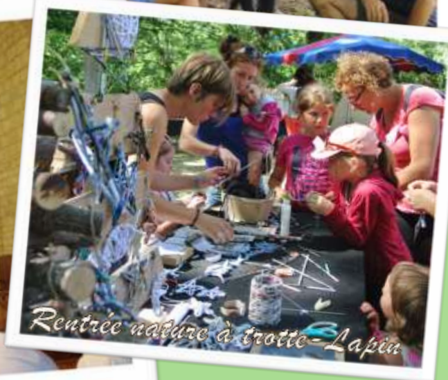
Rentrée nature à trotte-Lapin