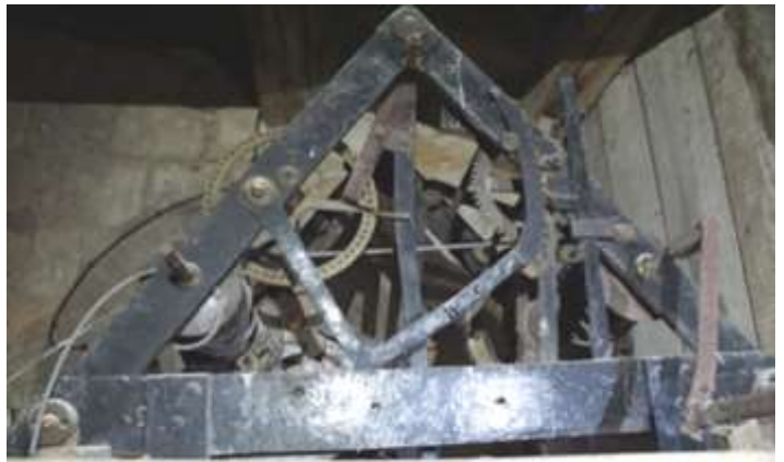
Le mécanisme ancien de l'horloge tel qu'on peut le voir dans les combles de l'église

En 2018, l'entreprise BODET de de Trémentines (49) a rénové les cloches (fait relaté dans le bulletin précédent) et l'horloge en même temps. Celle-ci a été déposée et emportée à Trémentines. Elle a été restaurée dans son état d'origine, on a conservé les aiguilles et repeint les chiffres. Une horloge électrique lui a été associée, pilotée par le moteur des cloches. De nouveau la petite cloche qui lui est asso-