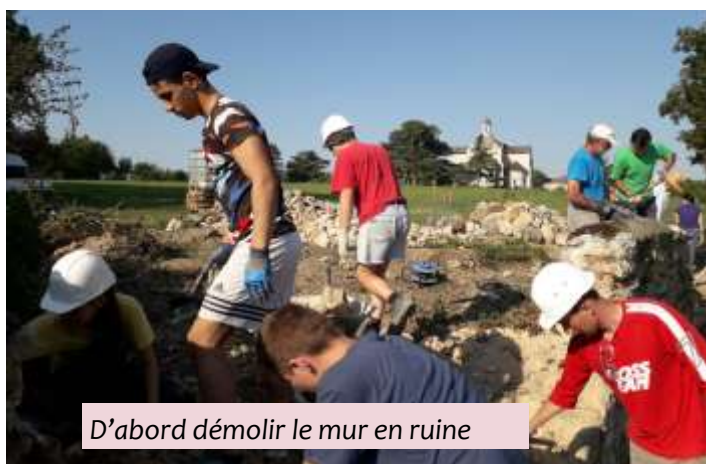
D'abord démolir le mur en ruine