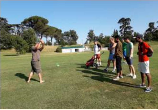
Initiation Golf au Château d'Allot