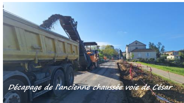
Décapage de l'ancienne chaussée voie de César

Il a été également décidé, hors marché, de refaire l'entrée du cimetière pour des raisons de sécurité et d'esthétique. Le portail sera rénové et de nouveaux piliers installés plus en retrait.