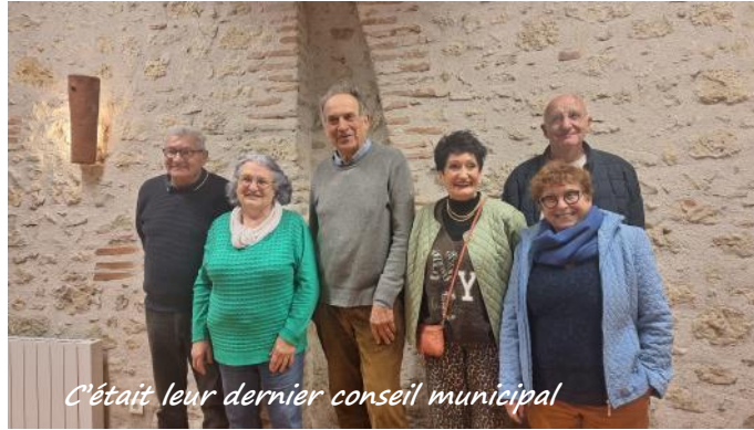
C'était leur dernier conseil municipal