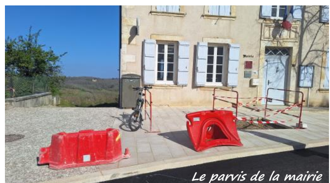
Le parvis de la mairie