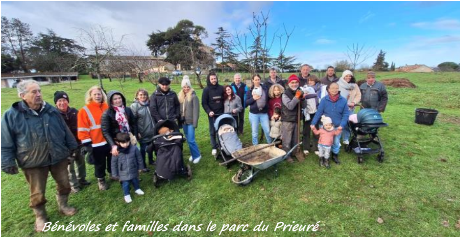
Bénévoles et familles dans le parc du Prieuré

L'opération, un enfant un arbre qui en est à sa cinquième édition, s'est déroulée le samedi 10 janvier.