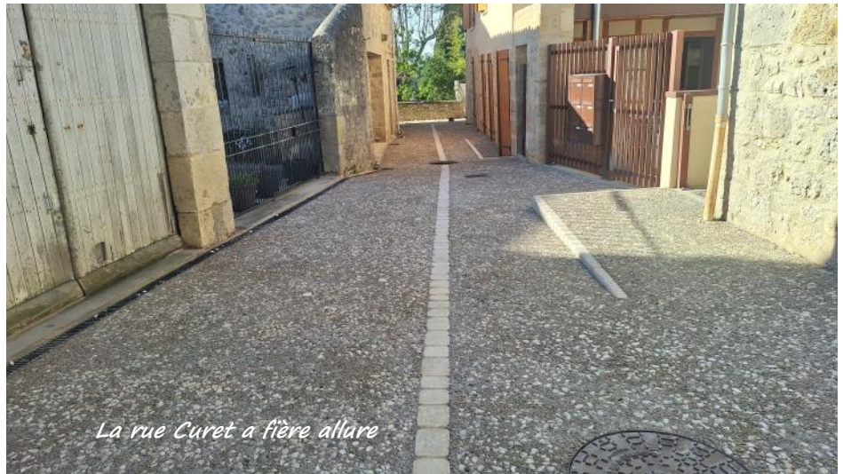
La rue Curet a fière allure

La rue Curet, située près de l'église, n'avait pas été achevée en raison de la réalisation des logements Domofrance en 2025. Profitant des travaux du bourg réalisés par l'entreprise ESBTP , la municipalité a commandé à cette dernière la réalisation d'un béton désactivé identique à celui de la Grand rue et du reste du village. Des riverains ont profité de la présence de cette société pour faire réaliser à leurs frais des revêtements similaires.