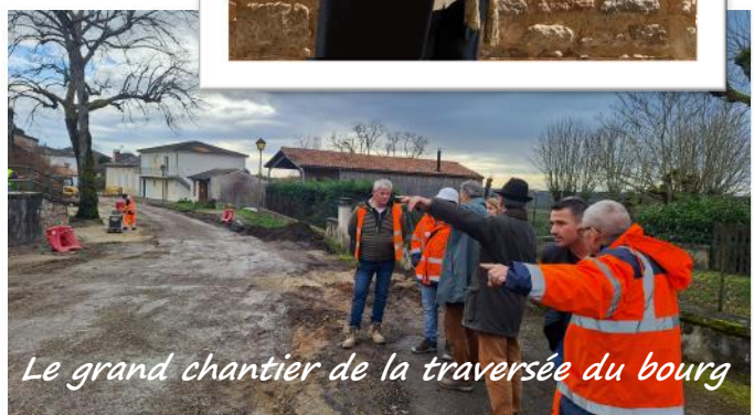
Le grand chantier de la traversée du bourg