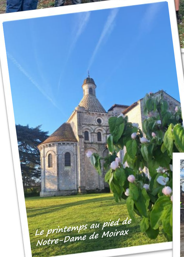
Le printemps au pied de Notre-Dame de Moirax