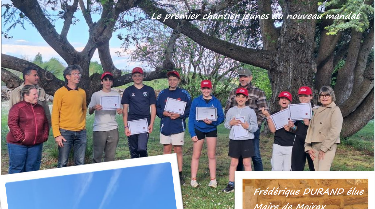
Le premier chantier jeunes du nouveau mandat